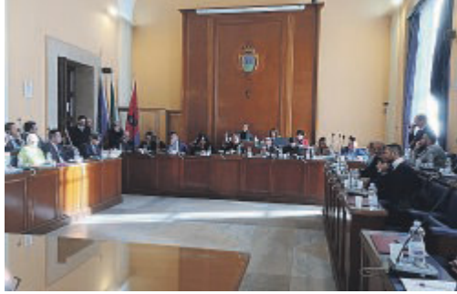
FOGGIA Una seduta del consiglio comunale

«La sindaca trova la sua ragion d'essere, il suo orizzonte politico e ideologico in un campo largo progressista che è sempre compatto. Per cui, qualunque decisione sarà assunta dalla mia persona, sarà sempre in nome e per conto dei 36.900 cittadini che ci hanno dato il mandato di governo per questo quinquennio. I costi invariati sono una mia prerogativa e su questo non transigo, che siano 3 o 5. Ovvio che, qualora optassimo per una composizione allargata, non sarebbe mai contrastiva con la nostra mission originaria che trae nel noi, nella collegialità, nella pluralità e nella coprogettazione assennata la propria forza e la propria ragion d'essere», ha spiegato la sinda-