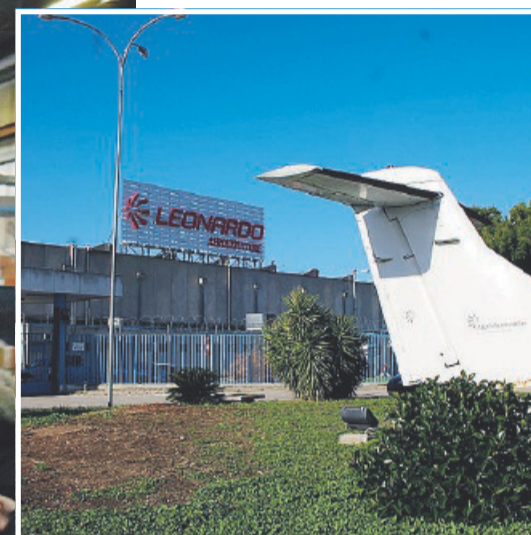
NUOVI INGRESSI L'ingresso dello stabilimento Leonardo, a sinistra la Tozzi Electrical Equipment

che ora con l'arrivo degli americani verrà cancellata: anche i posti di lavoro sono a rischio, ed è questo l'unico neo di una giornata di festa per l'industria foggiana.