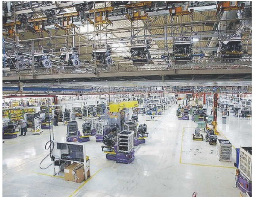
CNH Lo stabilimento industriale di Foggia

Nello stabilimento pugliese la produzione di motori agricoli