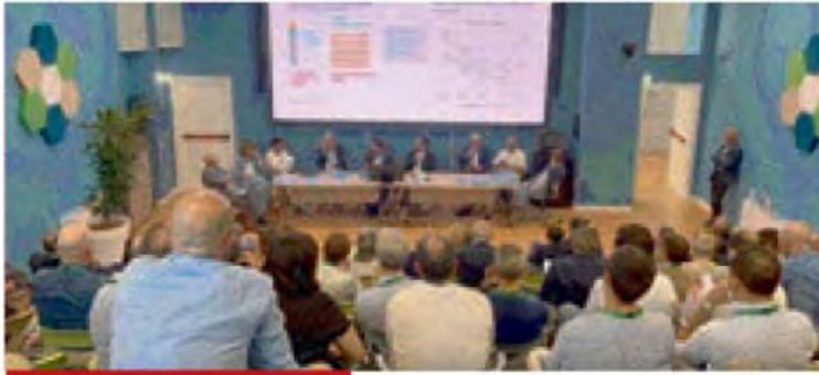
Un momento dell'incontro