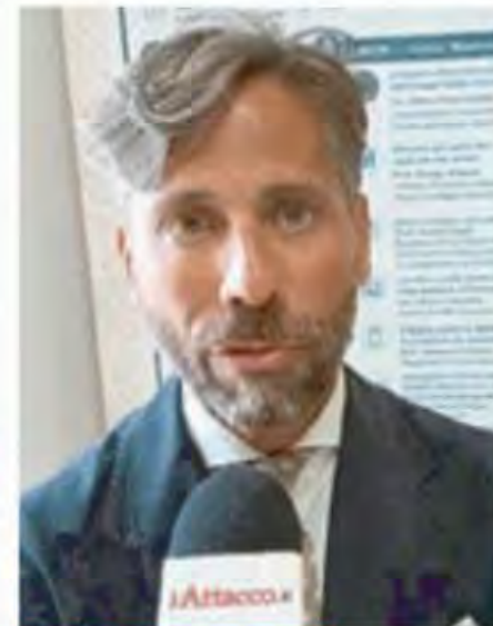
Presidente della sezione Terziario