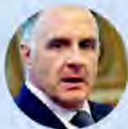
Emanuele Orsini. Presidente di Confindustria