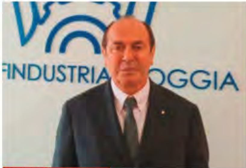
Il presidente dell'associazione dell'aquila

“Il caso dei progetti PINQuA di Foggia è emblematico. Da quanto emerge, numerosi interventi destinati a migliorare la qualità dell'abitare, creare nuovi alloggi e riqualificare aree degradate rischiano il definanziamento perché non compatibili con le tempistiche del PNRR. Una situazione che rappresenta una sconfitta per tutta la comunità. Ogni euro del PNRR che il nostro territorio perde significa meno lavoro per le imprese, meno occupazione per i nostri giovani, meno in-