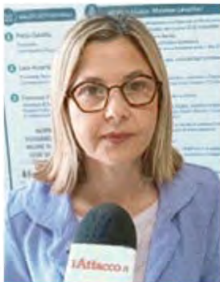
La prima firmataria della Legge 166/2016