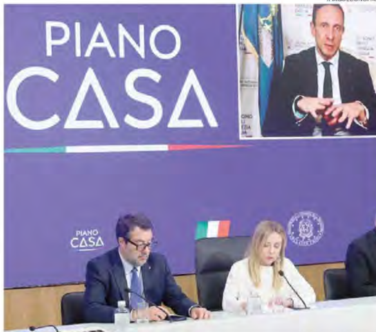
Le iniziative. Sul fronte privato prendono forma i primi investimenti