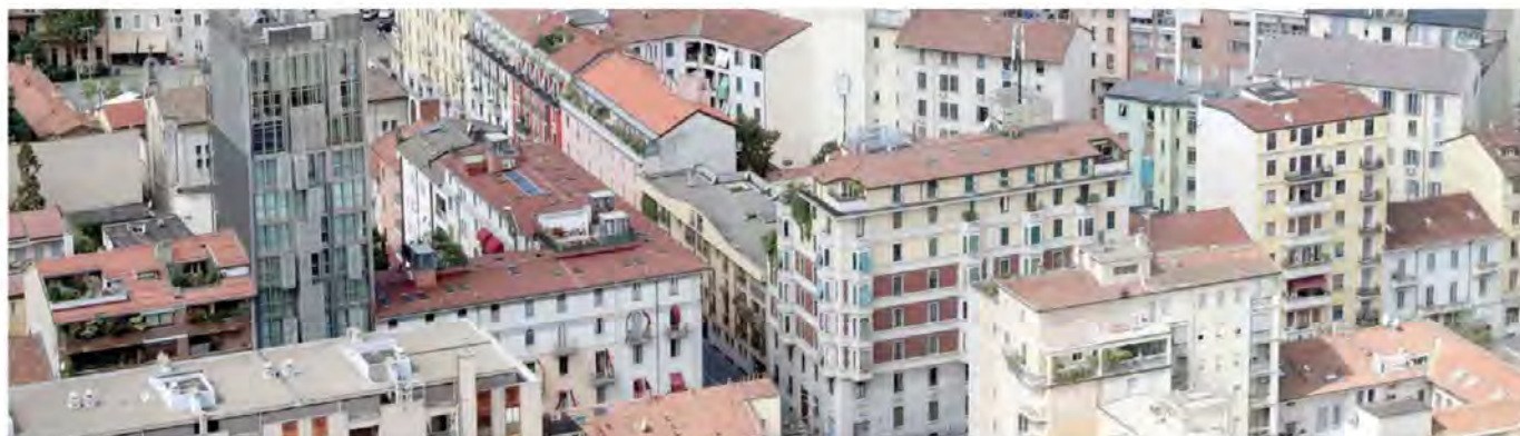
La conferma. Non ci sono stati stravolgimenti in Parlamento. Il Piano casa approvato ieri conferma, nelle parti più rilevanti,