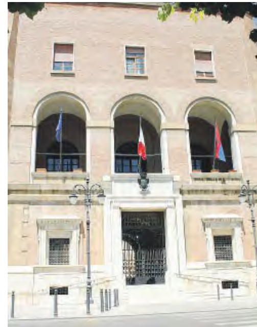
FOGGIA Palazzo di città

La decisione assunta ieri dal Consiglio per le imprese e le famiglie