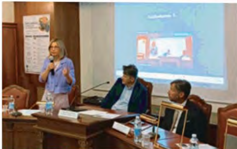
Un momento del convegno