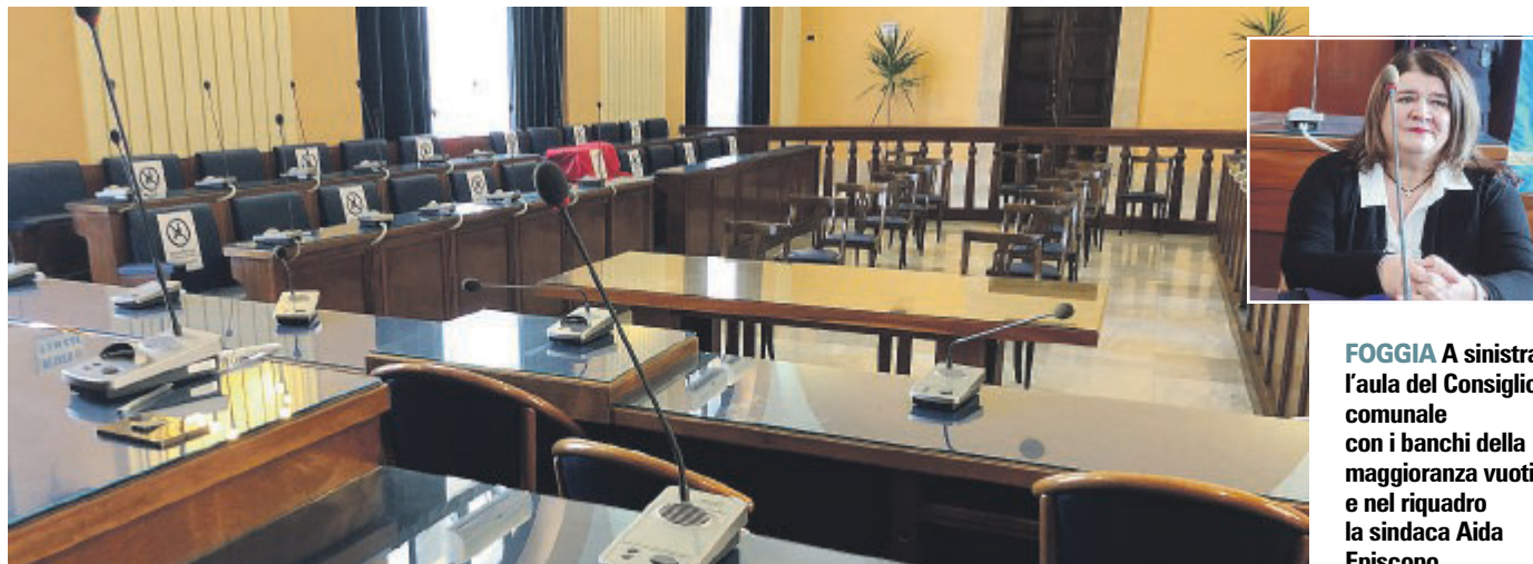
FOGGIA A sinistra l'aula del Consiglio comunale con i banchi della maggioranza vuoti e nel riquadro la sindaca Aida Episcopo

Le tensioni interne a Pd e M5s non si sono ammorbidite: «Non potevo fare altrimenti». Le opposizioni: un teatrino