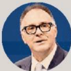
EMANUELE ORSINI Presidente di Confindustria