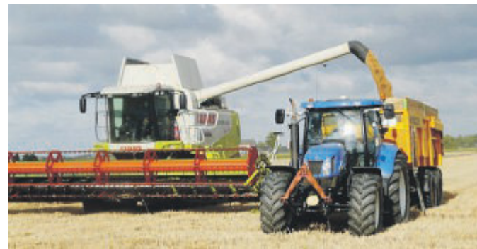
FOGGIA A breve inizierà la raccolta del grano duro. La Capitanata detiene il record nazionale di produzione

«L'auspicio è che si possa aprire un confronto costruttivo per migliorare l'attuale assetto, valorizzando il contributo di tutti gli operatori e riconoscendo il ruolo strategico della provincia di Foggia. Resta centrale un principio: il prezzo del grano è determinato dalle dinamiche di domanda e offerta su scala globale. Per questo, ogni strumento istituzionale deve essere in grado di accompagnare il mercato in modo equilibrato ed efficace», conclude il presidente dell'Unione stoccatore di Confcommercio.