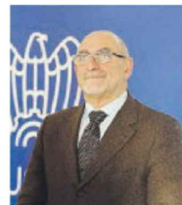
Nicola Delle Donne

In questa prospettiva si inserisce anche il tema degli insediamenti produttivi e dell'attrazione degli investimenti. Delle Donne ha ribadito l'importanza di favorire l'arrivo di operatori qualificati e capaci di generare occupazione stabile, innovazione e ricadute economiche diffuse, privilegiando progetti solidi e fortemente integrati con il tessuto produttivo regionale. Il confronto si è quindi concentrato sul rafforzamento delle infrastrutture logistiche, considerate un elemento essenziale per sostenere la crescita delle filiere industriali. In particolare, sono state esaminate le opportunità legate allo sviluppo della logistica portuale, dei poli del freddo a servizio dell'ortofrutta e dei corridoi cargo destinati a collegare in modo più efficiente le aree produttive del Sud-est barese e del Tarantino. «La Puglia ha le risorse, le competenze e la posizione geografica per giocare un ruolo da protagonista nello scenario produttivo nazionale ed europeo - dichiara il Presidente Delle Donne -. Ma servono norme che facilitino gli investimenti, una programmazione efficace e una visione condivisa tra istituzioni e imprese». «L'incontro di oggi - ribadisce Decaro - è stato costruttivo e incentrato su proposte su cui la Regione ha già cominciato a lavorare. Su tutte, l'aggiornamento del catalogo formativo e le filiere del made in Puglia con un incentivo sulla trasformazione industriale dei nostri prodotti».