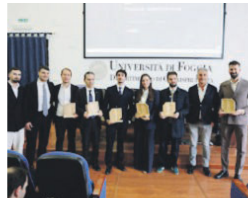
Le imprese premiate all'Università di Foggia

I riconoscimenti consegnati in una cerimonia all'Università di Foggia