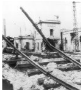
I bombardamenti del '43

La serata del 27 maggio intende dunque trasformare il ricordo storico in un'occasione di partecipazione collettiva e di educazione alla pace, coinvolgendo istituzioni, associazioni, cittadini e mondo culturale in un percorso condiviso di memoria pubblica.