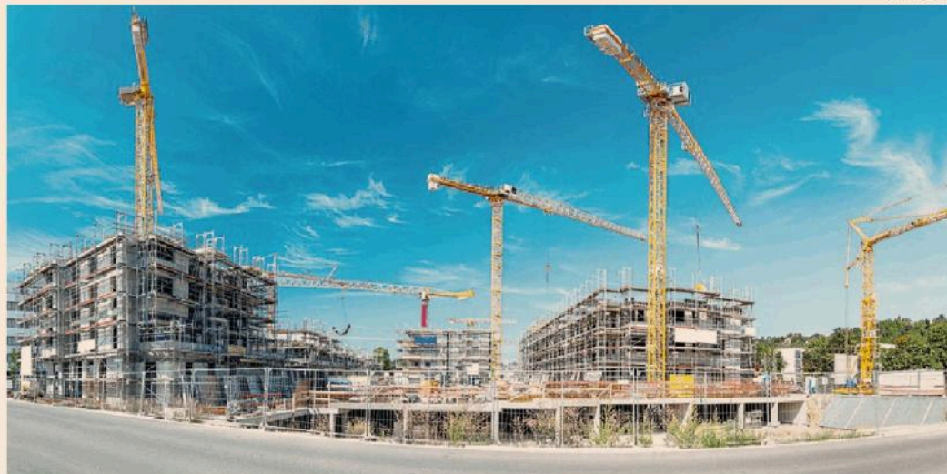
Piano casa. Le imprese chiedono un rinforzo con l'introduzione di ulteriori misure finanziarie e fiscali