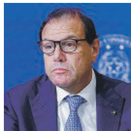
MEFIL VICEMINISTRO Maurizio Leo

● ROMA. Nessuno tocchi la casa. Giorgia Meloni promette tempi certi per gli sfratti all'assemblea di Confedilizia. Matteo Salvini chiede di abolire i vincoli sugli affitti brevi. Dal Tesoro, Maurizio Leo apre alla cedolare secca per i negozi - «è l'obiettivo» - e alla proroga dei bonus ristrutturazioni al 50% sulla prima casa e al 36% sulle seconde, se si troveranno le risorse.