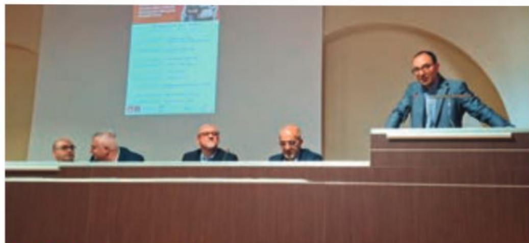
Open Day all'Altamura