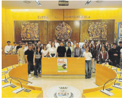
La presentazione dei progetti

L'istruttoria e la valutazione delle proposte secondo criteri fissati nel bando, vale a dire qualità, impatto sociale, sostenibilità e capacità di generare inclusione, è stato frutto di un lavoro condiviso tra i Servizi Sociali del Comune di Manfredonia, l'Associazione Cantiere Giovani e l'Associa-