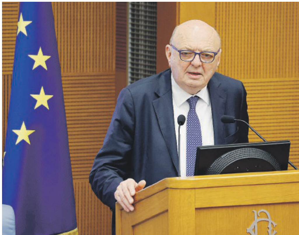
MINISTRO DELL'AMBIENTE L'azzurro Gilberto Pichetto Fratin

«Ci sono due questioni da analizzare separatamente: l'oggi e il futuro. Oggi siamo vittime delle scelte che determinano il prezzo dell'energia e principalmente del gas. Il modo per intervenire è di certo aumentare le rinnovabili e raggiungere l'obiettivo di 130 Giga-Watt al 2030. Però dobbiamo anche tutelare i territori, non possiamo procedere in disordine. Le Regioni stanno lavorando con attenzione all'in-