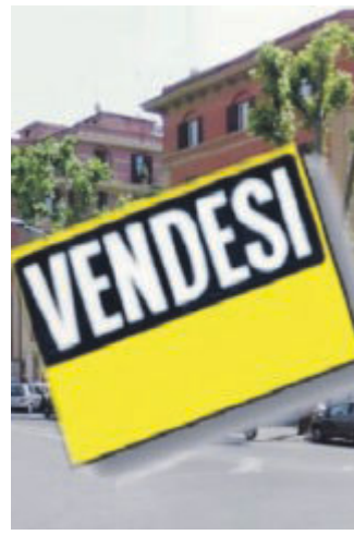
CASE Cresce il mercato immobiliare

Nel complesso, il 2025 consegna una Puglia che non solo segue la ripresa nazionale, ma la interpreta con una propria identità: un mercato giovane, sostenuto dal credito, con valori in crescita ma ancora competitivi, e una domanda che si muove tra prima casa, investimento turistico e consolidamento patrimoniale. Un territorio che, nei numeri notarili, sci conferma uno dei motori immobiliari più solidi del Mezzogiorno.