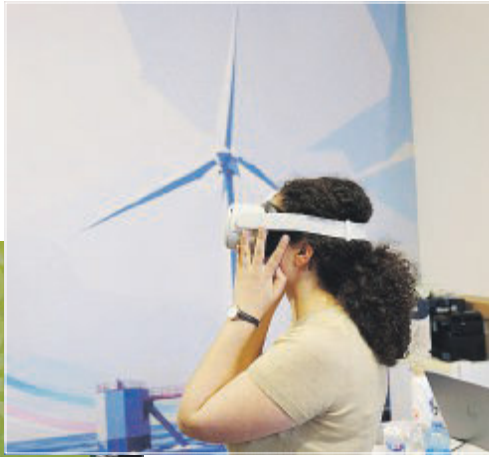
ENERGIE RINNOVABILI Nella foto grande il panel dedicato alle prospettive dell'agrivoltaico. In alto, una studentessa prova il visore tra gli stand della manifestazione