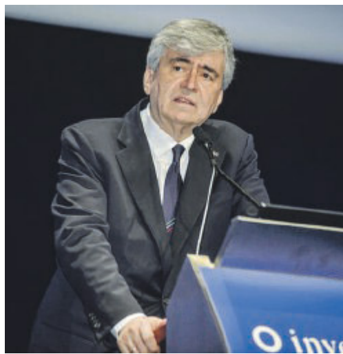
TURISMO E ZES UNICA Il ministro Gianmarco Mazzi è intervenuto al forum «Verso Sud» di Teha Group (The European House - Ambrosetti) a Sorrento