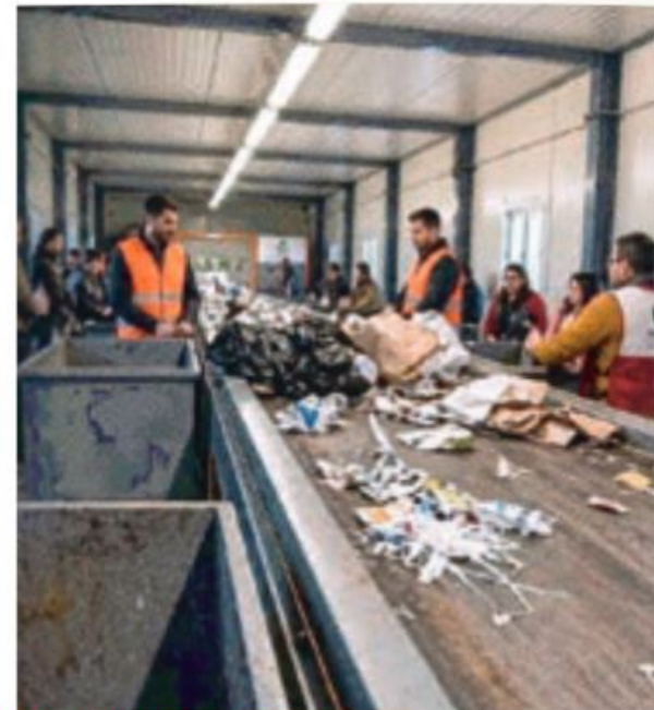
Operatività de La Puglia Recupera

S ignificativa cerimonia del "Premio Unimpresa 2026", iniziativa promossa dall'Università di Foggia con l'obiettivo di valorizzare le migliori esperienze legate all'innovazione sviluppate da imprese, enti pubblici, start up e organizzazioni del Terzo Settore, favorendo il dialogo tra il mondo accademico e l'ecosistema produttivo. Il premio, a cura dell'area terza "Missione e Grant Office" dell'Ateneo, nasce per sostenere la diffusione di modelli innovativi e sostenibili, promuovendo la collaborazione tra ricerca, impresa e territorio e incentivando la crescita di soluzioni ad alto impatto sociale, economico e ambientale". L'iniziativa, avviata attraverso un bando pubblico, ha coinvolto 39 organizzazioni tra enti pubblici, del Terzo settore, Start up, Pmi e grandi imprese.