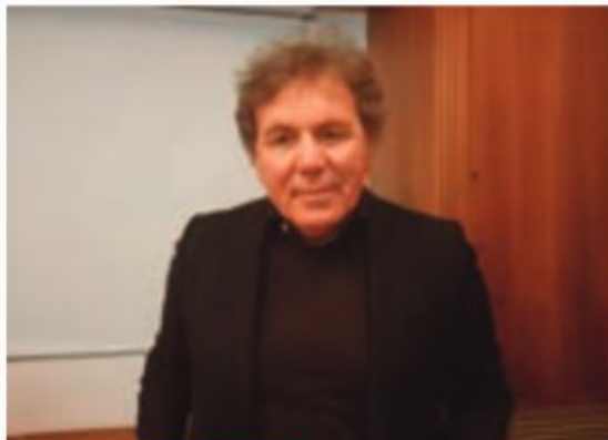
Presidente regionale degli edili