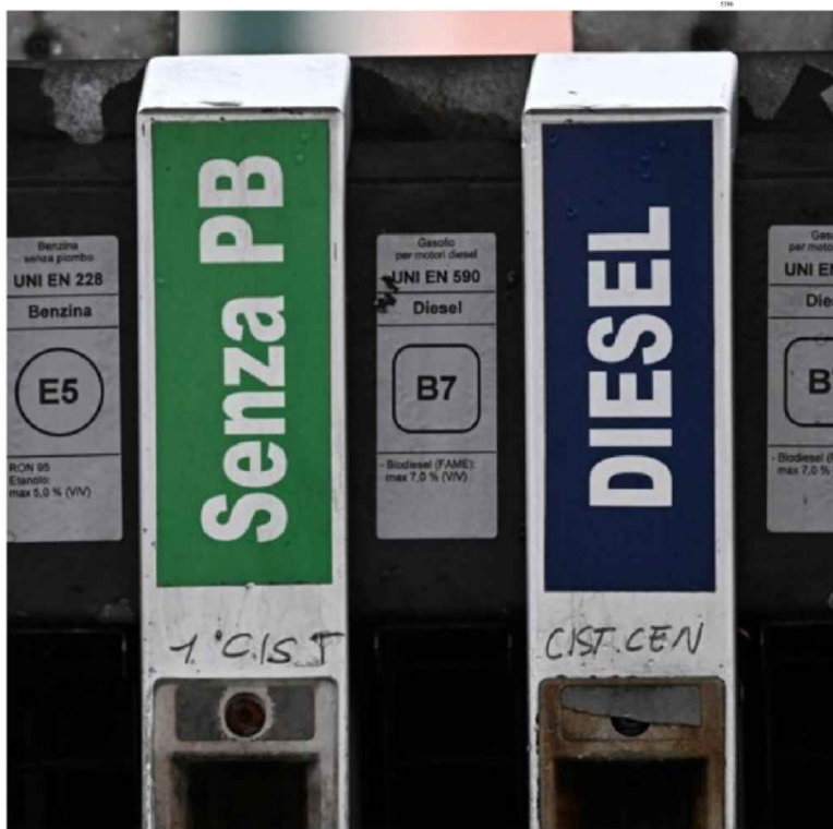
Caro carburanti. Crescono gli incassi dell'Iva sui prodotti energetici