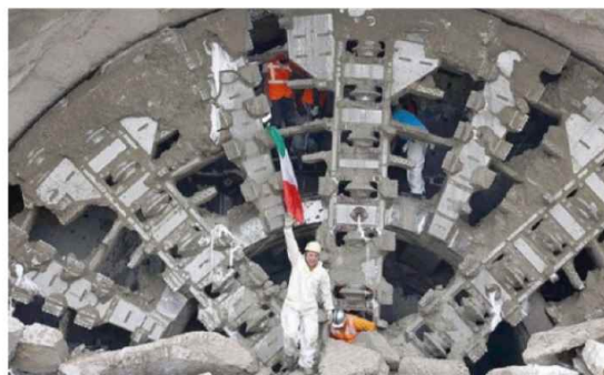
Ultimo diaframma. La talpa "Futura" arrivata alla fine della Galleria Rocchetta