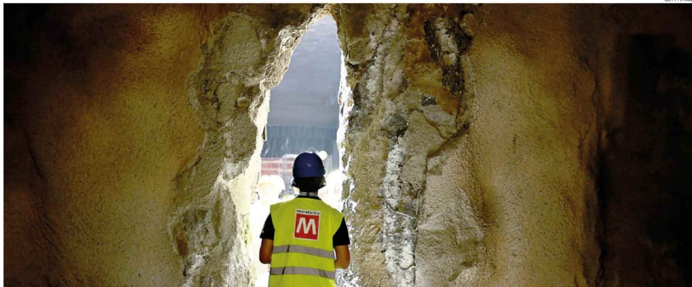
Certezze sul lavoro. Un migliore coordinamento porta a maggiori certezze per gli appalti e i contratti. Nella foto i lavori di scavo della nuova metropolitana di Torino