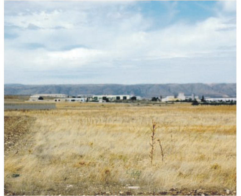
MANFREDONIA Il sito scelto da Enagas

A 10 anni dal referendum viene riaperta la pratica per l'autorizzazione