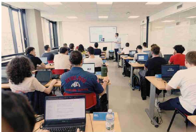
Formazione. Gli studenti di un Its Academy