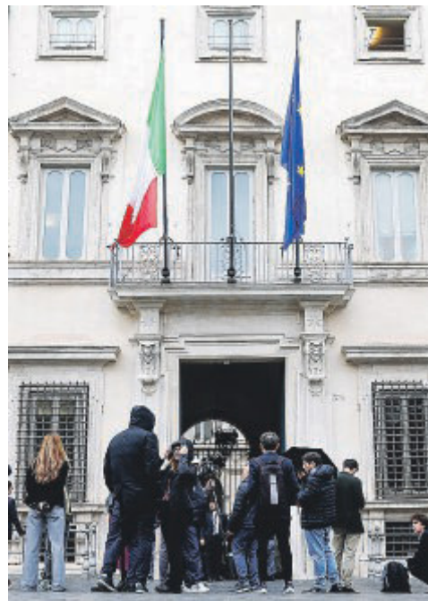
ROMA La sede del governo a Palazzo Chigi

Il tema delle risorse rimane quanto mai centrale, in una situazione di incertezza come l'attuale, con l'impatto economico ed energetico del conflitto in Medio Oriente, e alla luce dello scenario determinato dal non aver centrato l'obiettivo del deficit al 3%, con la procedura di infrazione Ue che resta aperta per l'Italia e l'idea non esclusa dal governo di uno scostamento di bilancio. Il vicepremier e ministro delle Infrastrutture e trasporti, Matteo Salvini, rilancia il pressing su Bruxelles: «E' urgente che sospenda le regole ferree dei bilanci e ci permetta di usare i soldi degli italiani per