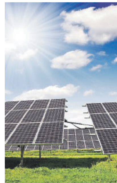
VALENZANO L'impianto sperimentale

A Valenzano l'impianto sui campi dell'azienda didattico-sperimentale Martucci