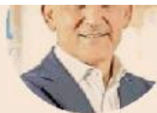
Amministratore delegato di A2A