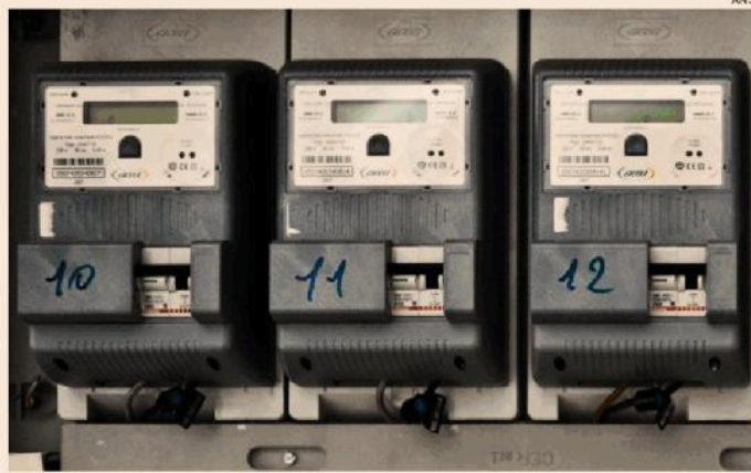
L'impatto della guerra. Il governo valuta un nuovo provvedimento per mitigarlo

Ci sono ancora un paio di settimane per mettere a terra decisioni finali. Un lasso temporale che servirà anche a Bruxelles per valutare quanto la crisi in atto determinerà strascichi tali da non essere rapidamente riassorbiti facilmente, nemmeno se si arrivasse in tempi non lunghissimi a una soluzione al conflitto e alla chiusura dello stretto di Hormuz. Per quanto la Commissione Ue al momento abbia chiuso alla possibilità di deroghe al patto di Stabilità, i dati in arrivo nelle prossime settimane (la stessa presi-