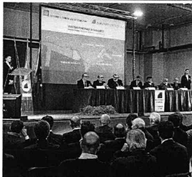
TAGLIO DEL NASTRO Il sindaco di Taranto e il ministro alle Infrastrutture Delrio. Alle loro spalle l'arcivescovo Santoro e il governatore Emiliano all'inaugurazione della piattaforma al porto di Taranto

chinson, proprio perchè non vedeva avanzare alcun cantiere. Mentre la piattaforma logistica è un progetto presentato all'Authority addirittura nel 2002 e solo ieri è stata inaugurata la prima delle cinque opere previste. «Ma quindici anni dopo è cambiato il mondo - commenta Delrio -, non solo la logistica e i trasporti». Ritardi, lungaggini e complicazioni burocratiche hanno segnato per lungo tempo la vita del porto di Taranto, ma adesso le cose stanno cambiando. Delrio lo riconosce e sottolinea: «Ero molto demoralizzato tempo fa. Adesso, invece, ho visto che le opere si stanno costruendo. Commissario dell'Authority e imprese hanno recuperato tantissimo e altri, importanti passi avanti sono sicuro che faremo l'anno prossimo. Posso dire che il porto di Taranto è "resuscitato". Adesso, però, va "abitato" dagli investitori e dalle imprese». La stessa piattaforma logistica, per esempio (un investimento pubblico-privato di 219 milioni di euro), ha bisogno di un terminal container operativo per far arrivare le merci, mentre oggi è deserto dopo l'abbandono di Tct. C'è ancora tanta strada da fare, Delrio lo riconosce, ma per il terminal apre uno scenario nuovo: «Non deve fare più solo transshipment come è sinora avvenuto con Evergreen, ma aprirsi ad una serie di attività. Noi stiamo lavorando in questa direzione».