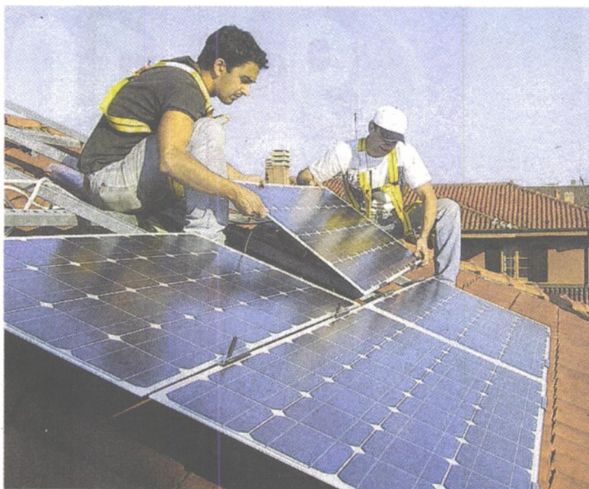
L'energia solare rappresenta una speranza contro i rincari delle bollette

● Incentivi a fondo perduto per l'installazione di pannelli fotovoltaici, gli impianti di accumulazione e le colonnine di ricarica delle auto elettriche delle flotte aziendali: è questo il piano della Regione per offrire aiuto alle aziende pugliesi in difficoltà a causa del rincari dell'energia. Potranno essere chiesti contributi all'investimento fino al 45% per le imprese di piccole dimensioni e fino al 35% per quelle medie.