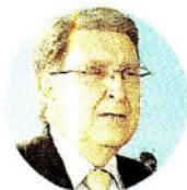
Infrastrutture. Enrico Giovannini

«Dal Senato esce confermato l'impianto di riforma degli appalti proposto dal Governo. Un anno fa si discuteva di azzeramento del Codice o, al contrario, di non fare nulla. Noi invece confermiamo il Codice introducendo elementi innovativi». A parlare, in un'intervista al Sole 24 Ore, è il ministro delle Infrastrutture, Enrico Giovannini.