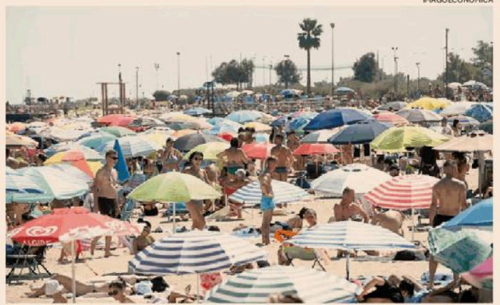
Dalle spiagge ai tribunali. C'è un ampio contenzioso relativo allo stipendio feriale

Infatti, secondo l'ordinanza, altrettanto rilevante è il profilo delle modalità di calcolo dello scostamento. La Suprema corte avalla il