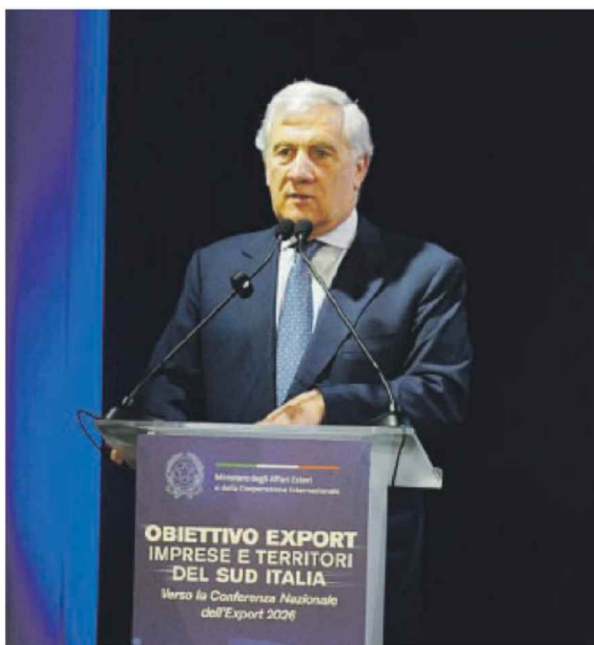
BARI Il vicepremier e ministro degli Esteri Antonio Tajani