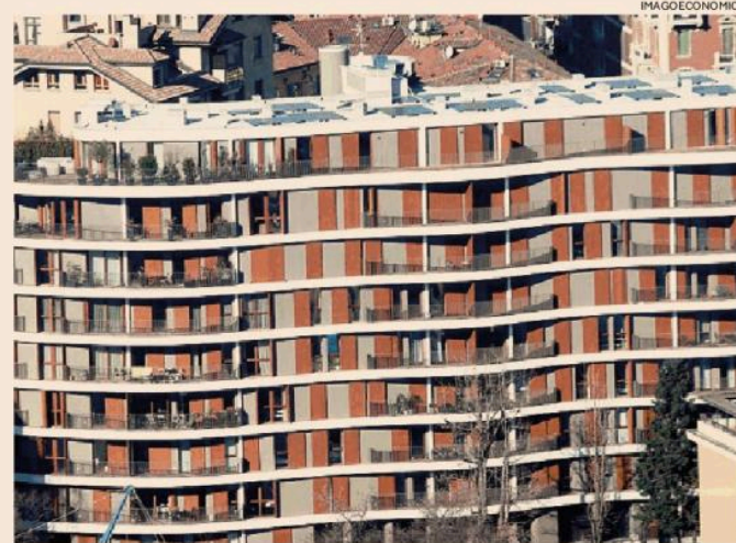
Risposta alla crisi abitativa. Il Piano Casa mira a un sistema abitativo accessibile

Ma vediamo le stime. Secondo le simulazioni elaborate dall'associazione, il Piano casa con il suo modello rigido di edilizia integrata consenti-