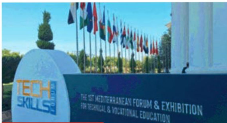
Il Forum al Cairo; a destra Euclide Della Vista