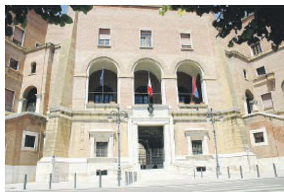
FOGGIA Palazzo di città, sede del Comune

presentarsi sempre compatti nei Consigli comunali», prosegue il documento elaborato dai capigruppo della maggioranza di centrosinistra che nelle ultime settimane aveva registrato un forte sbandamento e non solo per via delle richieste