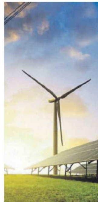
RINNOVABILI Ulteriori incentivi