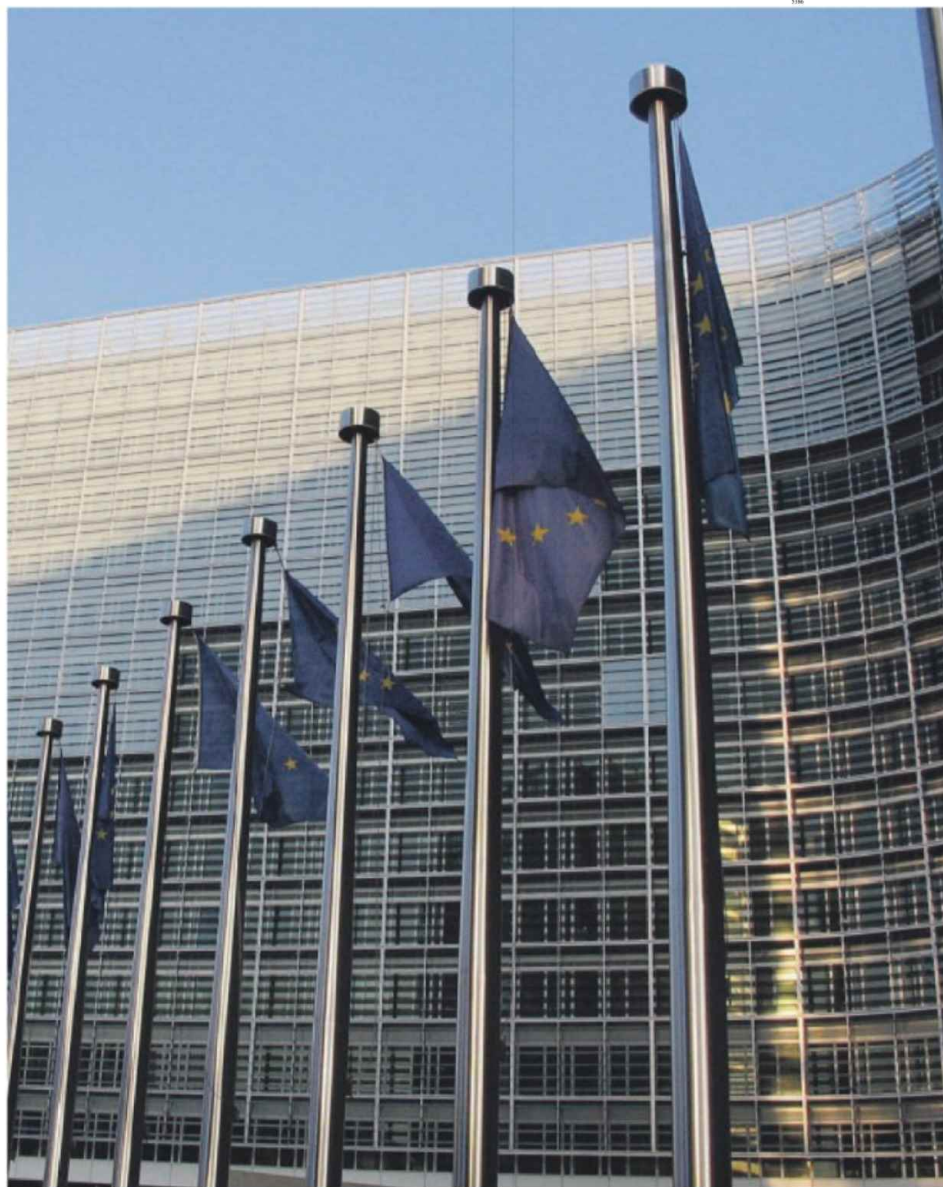
la sede della Commissione europea a Bruxelles