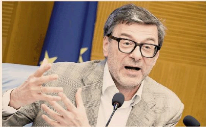
Il ministro Giorgetti esulta.

«L'Italia ancora una volta indica la strada», rivendica la premier Giorgia Meloni, citando anche l'accordo sui rimpatri. «La maggiore flessibilità di bilancio ci consentirà di spendere 14 miliardi in tre anni per mitigare l'impatto dell'aumento dei prezzi dell'energia che colpisce le famiglie vulnerabili, le imprese energivore, gli italiani». E il ministro dell'Economia, Giancarlo Giorgetti, può dirsi «soddisfatto perché la Commissione, impensabile fino a qualche mese fa, ha recepito le nostre proposte, frutto di un lavoro lungo, serio e riservato». «Noi portiamo a casa i risultati, su questo dossier ci sono stati troppi gufi», aggiunge. L'ottimismo sull'esito del negoziato, espresso dal ministro al Festival di Trento (Il Sole 24 Ore del 22 maggio), si è rivelato insomma ben riposto.