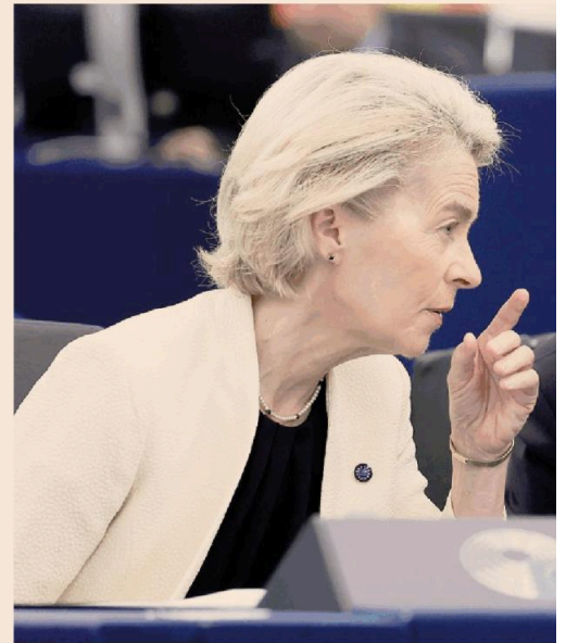
Le raccomandazioni della Commissione Ue all'Italia

Infine, Bruxelles ha fatto il punto anche sugli squilibri economici. Tre paesi non sono più oggetto di questa procedura - la Grecia, i Paesi Bassi e la Svezia -, «poiché le loro vulnerabilità macroeconomiche sono diminuite nel corso degli anni». L'Italia, l'Ungheria e la Slovacchia continuano invece a registrare squilibri, «poiché le loro vulnerabilità rimangono significative». La Romania, infine, continua a registrare squilibri macroeconomici eccessivi, «poiché le sue vulnerabilità restano gravi».