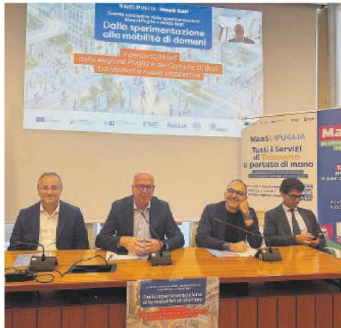
REGIONE L'incontro nella sala Di Jeso della presidenza