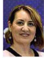
Determinata Chiara Gemma, eurodeputata di Fdi