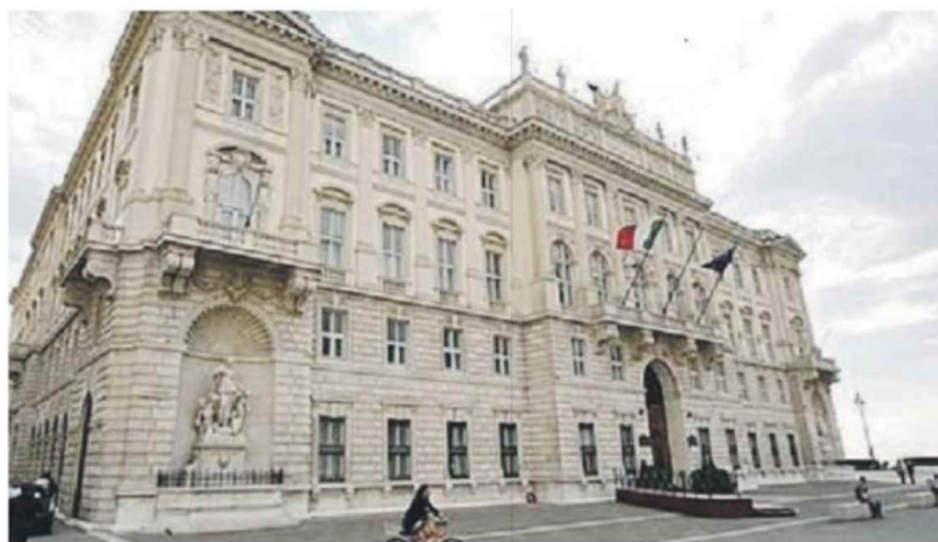
ROMA Una veduta esterna della sede della Cortei dei Conti