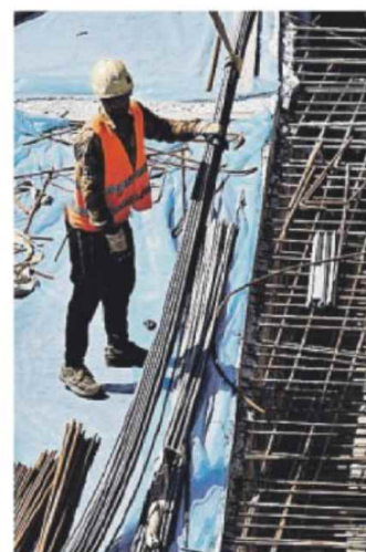
EDILIZIA Un operaio in un cantiere