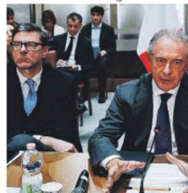
I MINISTRI Giorgetti e Urso

La 5 Stelle Chiara Appendino ha chiesto le dimissioni di Urso e accusato: «Non è un salvatore, ma un sabotatore delle imprese».