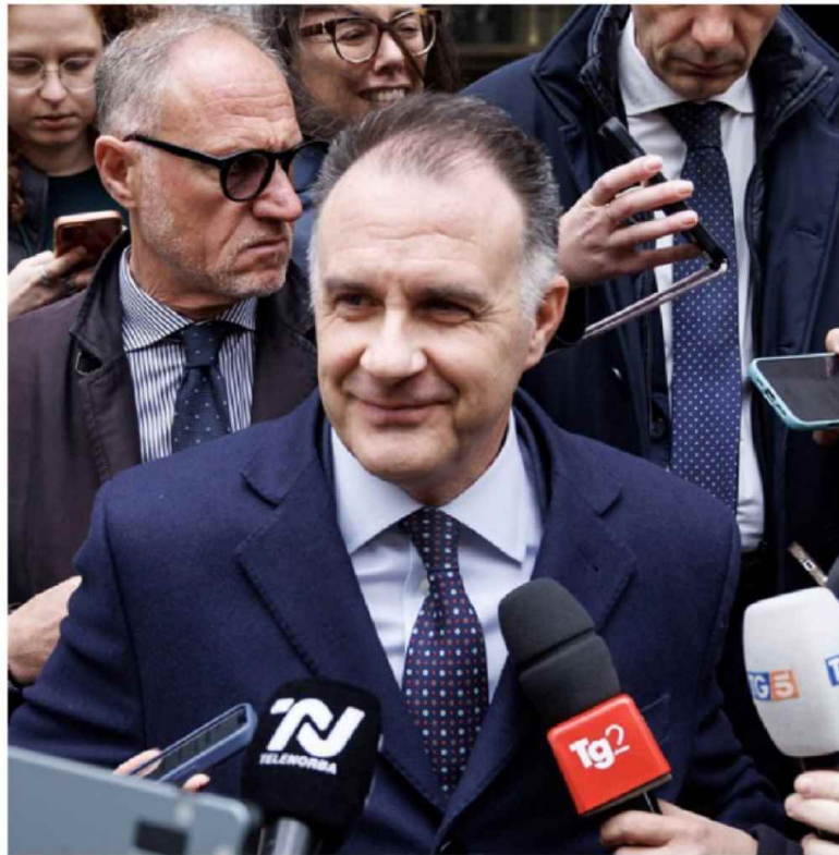
Imprese. Il presidente di Confindustria Emanuele Orsini