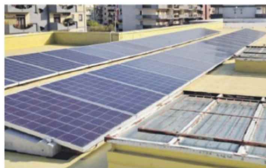
PUGLIA Pannelli solari di una comunità energetica