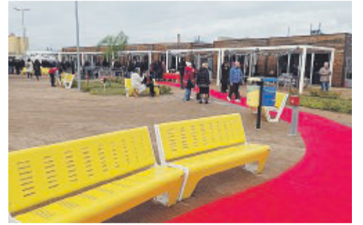
Il pubblico allo Slow Park di Foggia

Prodotti a km 0 e attività sociali e culturali nel cuore del rione Ferrovia