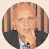
GIANNI MURANO È il presidente dell'Unione energie per la mobilità (Unem)

Nel check dell'Unem è inoltre contenuta una puntuale disamina dei carburanti. «Colpisce la crescita della benzina che è tornata ai livelli del 2011 - ha spiegato Murano -, con 9 milioni di tonnellate, sostenuta soprattutto dalla diffusione delle auto ibride». Che, con i modelli a benzina e sempre più di segmento medio-grande (Suv e crossover che coprono il 58% delle nuove immatricolazioni), stanno diventando l'opzione preferita nelle scelte degli italiani. «Sono una forma di transizione "graduale" verso una mobilità più sostenibile - ha chiarito il presidente -, in cui anche i biocarburanti potranno giocare un ruolo importante». Tanto più se, ha rimarcato Murano, lo spiraglio aperto dall'Europa si tradurrà in una mossa concreta: «Ci aspettiamo un passo avanti da parte di Bruxelles sui biocarburanti in modo che possano essere considerati come un vettore della transizione energetica».